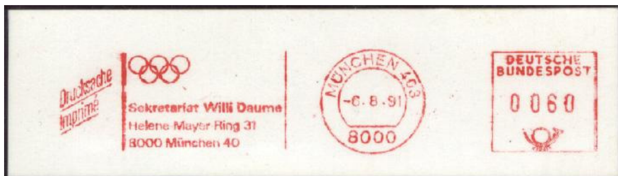
Ryc.4. Frankatura firmowa sekretariatu byłego olimpijczyka – koszykarza z igrzysk w Berlinie 1936 r.

Poczta niemiecka używała kilku frankatur mechanicznych poświęconych głównemu organizatorowi Igrzysk olimpijskich w Monachium w 1972 roku, szefowi niemieckiego komitetu olimpijskiego. Willi Daume, bo o nim mowa, grał w niemieckiej reprezentacji koszykarzy na igrzyskach w Berlinie w 1936 r.