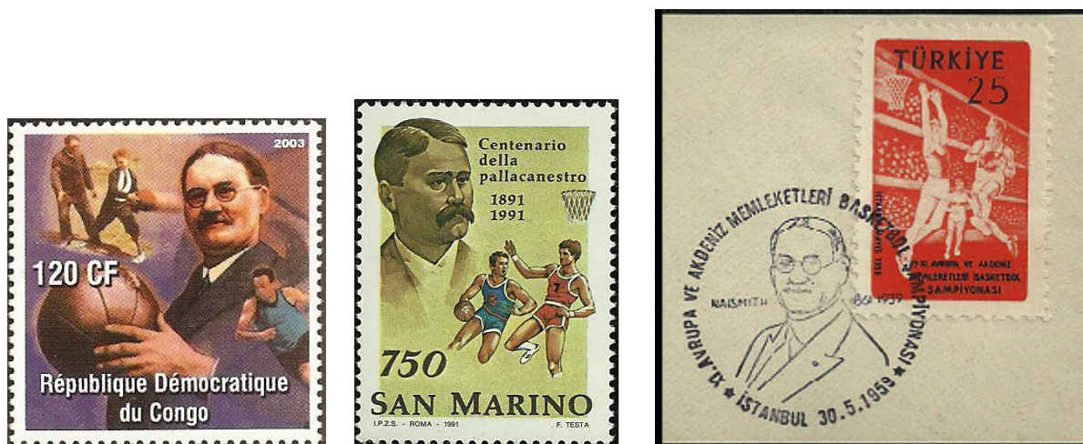
Ryc.5. James Naismith

Można sięgnąć do olimpijskich archiwów, spisać daty rozgrywania turnieju i poszukać olimpijskiego datownika okolicznościowego z dnia pierwszego lub finałowego meczu.