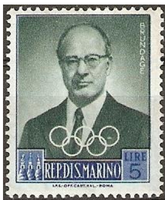
Ryc.3. Znaczek przedstawiający Avery Brundage'a z odpowiednią informacją znalazł się w ekspozycji.

W ekspozycji tematycznej obowiązuje zasada pisania tylko o tym, co można zobrazować odpowiednimi znakami pocztowymi. Co można zrobić w sytuacji, gdy dla dobra ciągłości narracji lub ważności jej fragmentu konieczna jest informacja o czymś, dla zilustrowania czego trudno znaleźć walory filatelistyczne? Znowu trzeba sięgnąć do zasobów wiedzy tematycznej i połączyć ją z wiedzą filatelistyczną (znajomość wydanego materiału filatelistycznego). W rozdziale poświęconym turniejom koszykarskim na igrzyskach olimpijskich trudno nie wspomnieć o tych, na których po raz pierwszy w oficjalnym programie pojawiła się koszykówka (Berlin 1936 rok). Kłopot polega na tym, że nie wydano z tej okazji żadnego znaku pocztowego. Poszukiwania dały rezultat. W 1960 roku poczta San Marino wydała serię znaczków z wizerunkami wybitnych działaczy sportowych i olimpijskich; wśród nich była podobizna Amerykanina Avery Brundage'a, wieloletniego przewodniczącego Międzynarodowego Komitetu Olimpijskiego. Na olimpijskim turnieju koszykówki w Berlinie w 1936 roku Avery Brundage pełnił funkcję sędziego.