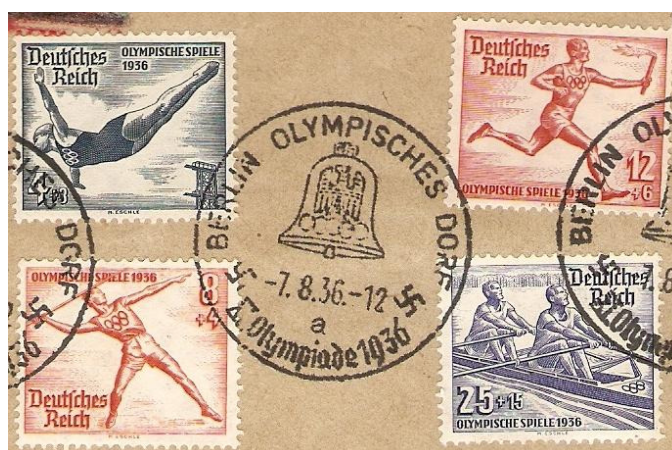
Ryc.6. Pierwszy mecz koszykówki w historii igrzysk olimpijskich odbył się 7. sierpnia 1936 r. w Berlinie

Można sięgnąć do olimpijskich archiwów, spisać daty rozgrywania turnieju i poszukać olimpijskiego datownika okolicznościowego z dnia pierwszego lub finałowego meczu.