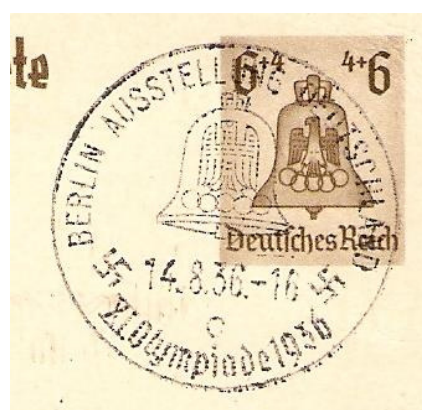
Ryc.7. Finałowe mecze i zakończenie turnieju miały miejsce 14. sierpnia 1936 r.

Wszystkie te walory można umieścić w ekspozycji, pod warunkiem solidnego opisu tematycznego, uzasadniającego ich wykorzystanie. Oprócz poradzenia sobie z problemem, jest okazja znowu wykazać się głęboką wiedzą tematyczną.