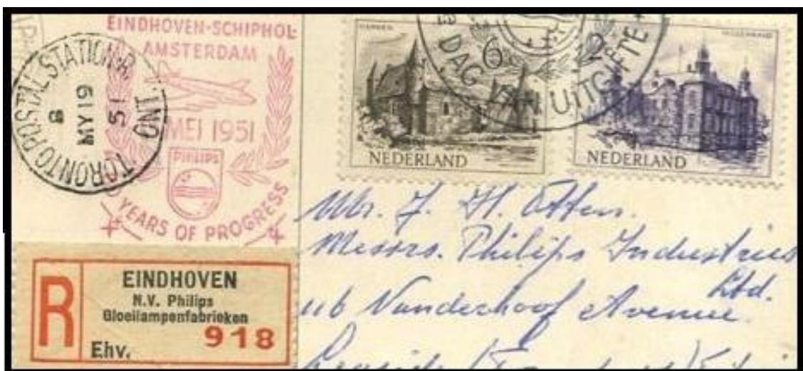
Ryc. 3. Reklama zakładów Philipsa na erce.