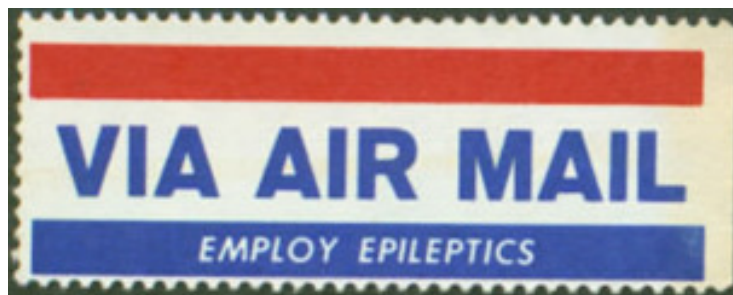
Ryc. 6. Zatrudnij epileptyków.