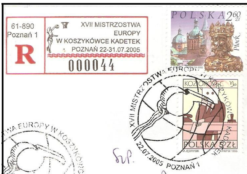
Ryc. 1. Nalepka polecenia z okolicznościowym napisem i rysunkiem.

Najpopularniejszą nalepką, powszechnie stosowaną, jest nalepka polecenia, erka (R – skrót od francuskiej nazwy „recommande”), używana już od lat siedemdziesiątych XIX wieku, a od 1880 roku wprowadzona przez UPU do obrotu międzynarodowego. W ekspozycie wykorzystać można samą nazwę miejscowości umieszczoną na nalepce (na warunkach opisanych w Filateliście 3/08), nazwę miejsca lokalizacji urzędu pocztowego lub dodatkowe rysunki i napisy na nalepkach okolicznościowych, wydawanych np. dla uczczenia uroczystości, rocznic, wydarzeń etc.