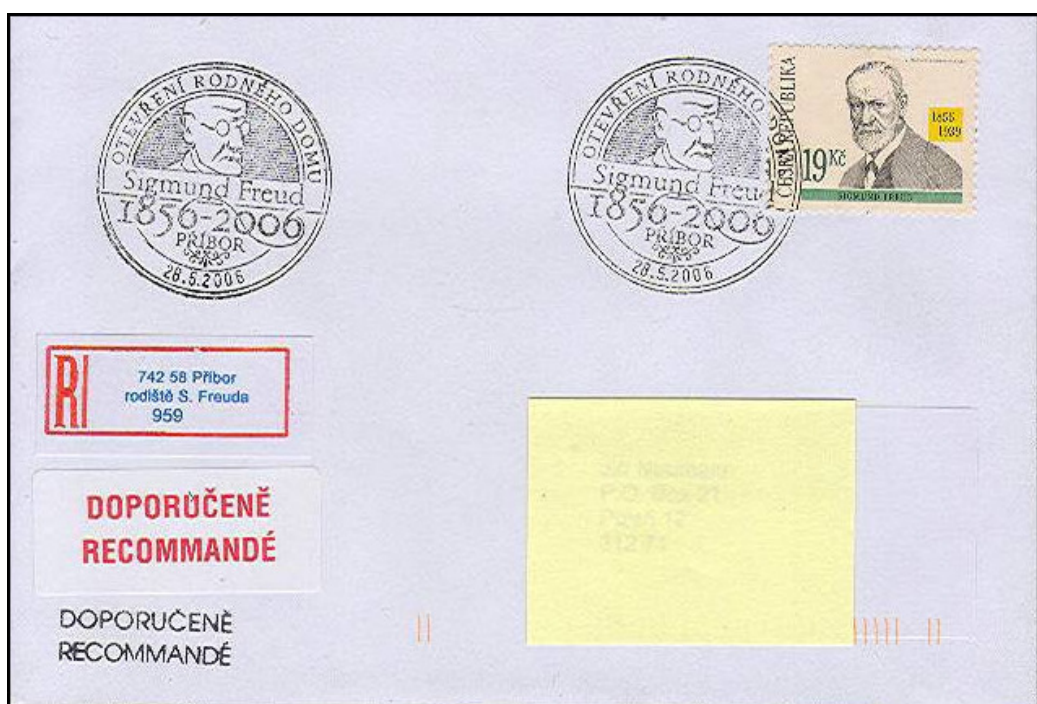
Ryc. 4. Miejsce narodzin Freuda można dokumentować treścią nalepki „R”.

Kolejną nalepką, którą warto pokazać w ekspozycji jest nalepka lotnicza, stosowana od 1912 roku jako pomocnicza do oznaczania rodzaju transportu przesyłki. Na niej, prócz różnorodnych określeń poczty lotniczej, można znaleźć przedstawione symbolicznie lub bardziej realistycznie samoloty i ptaki, rzadziej inne rysunki, a niekiedy również teksty.