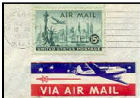
Ryc. 5. Sylwetki samolotów są najczęstszym elementem rysunkowym nalepek poczty lotniczej.