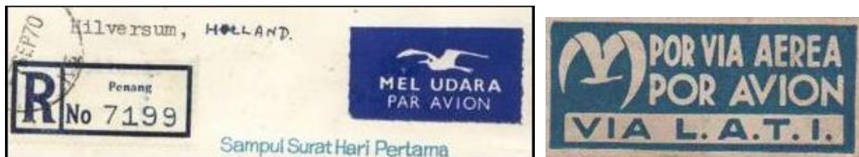
Ryc. 8. Sylwetki ptaków na lotniczych nalepkach z Malezji i Brazylii.

Do ostrożnego obchodzenia się z przesyłką np. paczkową skłaniać powinna ochronna nalepka pomocnicza, zawierająca często słowną lub rysunkową informację o zawartości, która może łatwo ulec zniszczeniu.