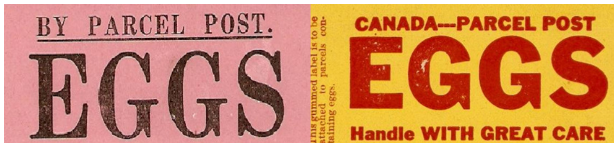
Ryc. 9. Brytyjska i kanadyjska nalepki paczkowe na przesyłki z jajami.

Do ostrożnego obchodzenia się z przesyłką np. paczkową skłaniać powinna ochronna nalepka pomocnicza, zawierająca często słowną lub rysunkową informację o zawartości, która może łatwo ulec zniszczeniu.