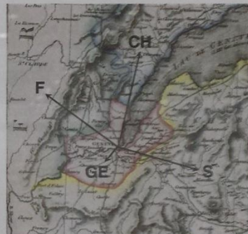
Excerpt of the Map of Switzerland by Wyld, London, 1847