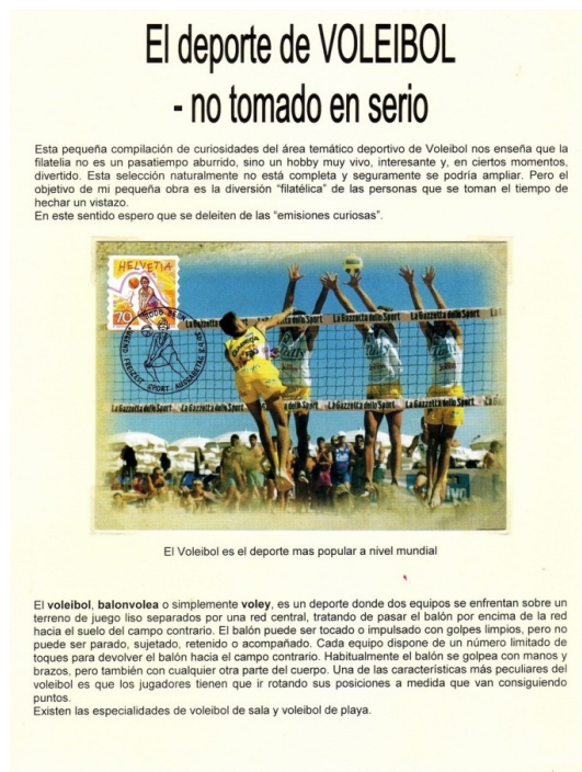
Ryc. 1. Ten wystawca popełnił podstawowy błąd, nie przedstawił żadnego planu, ograniczył się tylko do opisu eksponatu.

Dobrze jest wprowadzić do planu elementy, frazy, słowa, które zaciekawiają, zatrzymają widza (a może i sędziego). Zamiast na początku planu eksponatu o koszykówce napisać zwięzajowo: